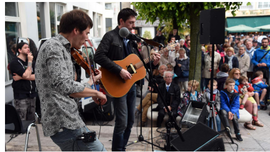
Fête de la Musique (2019)

La musique entre dans les prisons, partage la vie des malades et du personnel de l'hôpital, rapproche les établissements scolaires de la musique, établit des liens et des échanges entre la ville et ses périphéries, irrigue les communes rurales, valorise le travail d'un individu, d'un groupe, d'une association ou de toute une communauté.